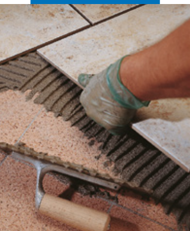
Sovrapposizione di un rivestimento in monocottura su marmette esistenti