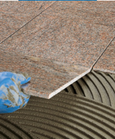
Posa di marmo prelevigato a pavimento

Nel caso di applicazione di lastre fonoassorbenti o isolanti, applicare Keraflex a cazzuola o a spatola a punti.