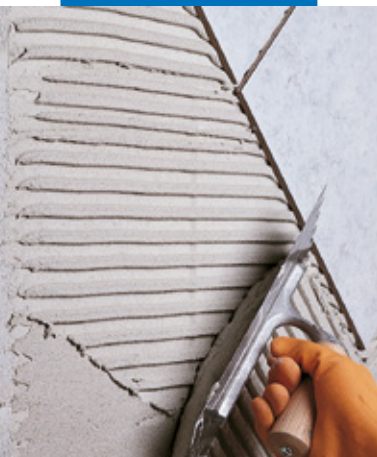
Posa di monocottura su parete in blocchi di cemento cellulare espanso