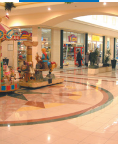
Esempio di posa di grès porcellanato - Centro Commerciale Zanchetta - Treviso

Le referenze relative a questo prodotto sono disponibili su richiesta e sul sito www.mapei.it e www.mapei.com